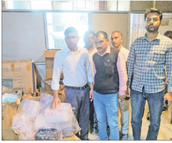
नारनौल। सिंगल यूज प्लास्टिक सामग्री व पॉलीथिन की जांच करते अधिकारी।

पालिका के अधिकारियों और प्रदूषण नियंत्रण बोर्ड के क्षेत्रीय अधिकारी को इन नियमों का उल्लंघन करने वालों पर जुर्माना लगाने तथा उसे वसूलने के लिए अधिकृत किया गया है। यदि कोई दोषी नागरिक व संस्था जुर्माने की राशि जमा नहीं करती है, तो इसकी वसूली भूराजस्व के बकाया की तरह कानूनी तौर पर की जाएगी। उन्होंने बताया कि एकत्रित की गई जुर्माने की राशि का उपयोग संबंधित क्षेत्र में कचरा प्रबंधन और सफाई व्यवस्था को बेहतर बनाने के लिए किया जाएगा। क्षेत्रीय अधिकारी ने जिले के सभी नागरिकों से अपील की है कि वे पर्यावरण संरक्षण में सहयोग करें और निर्धारित स्थानों के अलावा कहीं भी कचरा न फेंके, ताकि क्षेत्र को स्वच्छ और सुंदर बनाया जा सके।