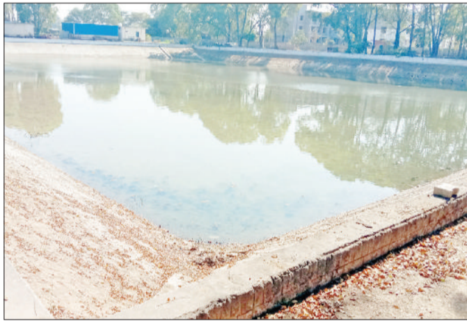
नारनौल। रेवाड़ी रोड पर बने वाटर टैंक में मौजूद पानी।

जनस्वास्थ्य विभाग के अधिकारियों के अनुसार शहर में जलापूर्ति का मुख्य आधार नसीबपुर स्थित वाटर ट्रीटमेंट प्लांट है, जहां से लगभग 70 प्रतिशत पेयजल की आपूर्ति होती है। इसके अलावा रेवाड़ी रोड स्थित वाटर टैंकों से करीब 25 प्रतिशत पानी सप्लाई किया जाता है। शेष मात्र पांच प्रतिशत जलापूर्ति नलकूपों के माध्यम से की जाती है। ऐसे में नहरों में पानी नहीं आने का सीधा असर पूरे शहर की जल व्यवस्था पर पड़ता है। धुलंडी के अवसर पर आमतौर पर जल की मांग बढ़ जाती है, लेकिन इस बार शहरवासियों को अतिरिक्त जलापूर्ति नहीं मिलेगी। विभाग ने स्पष्ट कर दिया है कि उपलब्ध सीमित जल भंडार को देखते हुए केवल नियमित और नियंत्रित आपूर्ति ही संभव है। ऐसे में लोगों को त्योहार के दौरान भी संयम बरतना होगा। विभाग की ओर से स्पष्ट किया गया है कि जैसे ही नहरों में पानी पहुंचेगा, प्राथमिकता के आधार पर वाटर ट्रीटमेंट प्लांट में जल भंडारण किया जाएगा, ताकि शहर में नियमित आपूर्ति बहाल की जा सके।