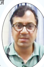
आयकर विभाग ने जो दस्तावेज मांगे वह दिखाए नहीं मिली विजय हॉस्पिटल में कोई खामियां

आंकड़ों में है, वहीं दर्शाए गए थे। सालभर की बात है। सभी मरीजों का ब्योरा दिया गया। आंकड़े बताए गए। हर तरह के दस्तावेज दिखाकर उन्हें संतुष्ट किया गया। किसी भी तरह की अनियमितताएं नहीं पाई गईं। हालांकि वह जानते हैं कि कुछ अफवाह फैल रही है लेकिन वह सरासर गलत है। अगर टीम अधिकारियों को कोई अनियमितताएं मिलती तो वह उसे जरूर आगे फारवर्ड करते या आगे अन्य एजेंसियों को भेजते। लेकिन ऐसा नहीं हुआ। उसके बाद ही कुंज नहीं मिला। उसके बाद टीम यहां से गई है। जो हमारे पास बैट उपलब्ध है, उन्हीं के डाटा