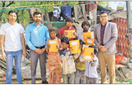
महेंद्रगढ़। जरूरतमंद बच्चों को शिक्षण सामग्री बांटते हुए।