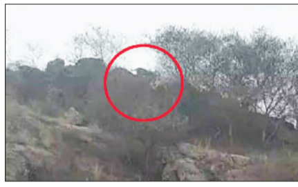
नारनौल। वीडियो में कैद पहाड़ी की चोटी पर दिखाई दे रहा तेंदुआ।

रविवार की रात पहाड़ी पर दिखा तेंदुआ, मंदिर की छत से लोगों ने बनाया वीडियो रेस्क्यू ऑपरेशन चलाने के लिए निदेश दिए। इसके बाद सोमवार शाम को पहाड़ी और इर्द गिर्द टीम ने रेस्क्यू ऑपरेशन चलाया गया। इस दौरान टीम को तेंदुआ नहीं मिला। आपको बताते चले कि नारनौल के आसपास के कई गांवों में पहले भी तेंदुए की मूवमेंट देखी जा चुकी है। हाल ही में गांव दत्तल में भी दो बार तेंदुआ दिखाई दिया था, जिसके बाद वन्यजीव विभाग ने वहां पिंजरा लगाकर उसे पकड़ने की कोशिश शुरू की हुई है। बताया जा रहा है कि रविवार शाम ढाणी किरारोद में पहाड़ी की तलहटी पर प्राचीन मंदिर है। इसी मंदिर की छत से बच्चों ने वीडियो बनाई, जिसमें पास के पहाड़ी की चोटी पर जानवर चहलकदमी करते दिखाई दे रहा है। बच्चों सहित ग्रामीण वहां से सुरक्षित जगह पहुंचे और इस वीडियो को सोशल मीडिया पर वायरल कर दिया। ऐसे में लगातार तेंदुए के देखे जाने की घटनाओं से ग्रामीणों में दहशत का माहौल है। ग्रामीणों ने वन विभाग से मांग की है कि जल्द से जल्द तेंदुए को पकड़कर सुरक्षित स्थान पर छोड़ा जाए ताकि किसी अनहोनी की आशंका को