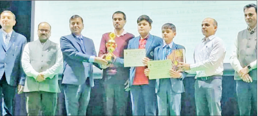
कनीना। विद्यार्थियों को सम्मानित करते संयोजक।